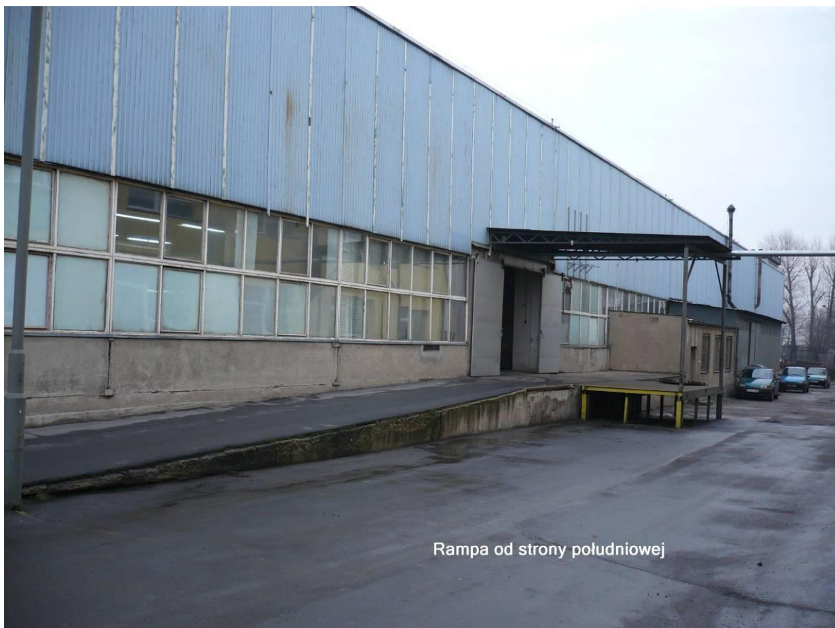
Rampa od strony południowej